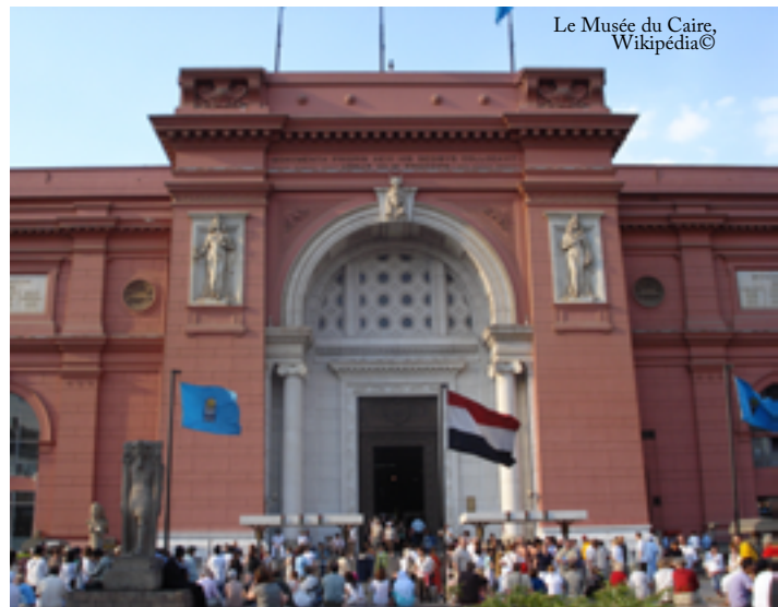
Le Musée du Caire

Un personnage appreni dans la Tradition Histoire invisible (Compacts secrets) sait que la momification est un procédé des Mystères empêchant le Nephilim de sortir de son corps et de se réincarner. L'Éveil nécessite l'emploi d'un rituel myste.