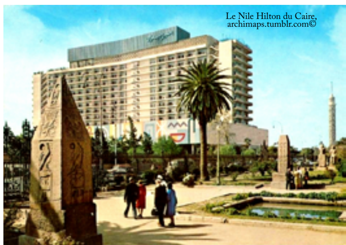
Le Nile Hilton du Caire

Le site est gardé par une dizaine d'hommes de main à la solde de la FIRM, et d'une demi-douzaine de policiers égyptiens. Leur chef, Abdul ben Azrahi, est une Lame du Sphinx. Il n'est normalement présent sur le site que le matin, jusqu'à onze heures.